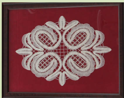
Készítette: Bessenyei Jánosné