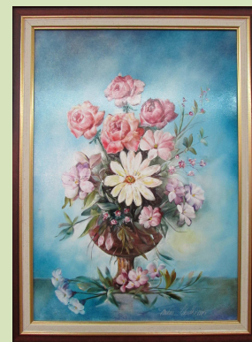
A festményeket Farkas László készítette

Az alkotások megtekinthetők ügyfélfogadási időben a Polgármesteri Hivatal Házasságkötő termében.