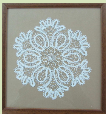
Készítette: Jászai Anikó