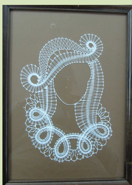
Készítette: Bessenyei Jánosné