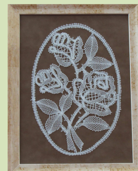
Készítette: Jászai Anikó