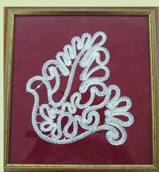
Készítette: Lukács Imréné