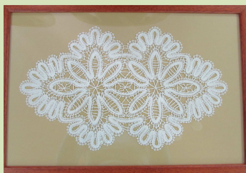
Készítette: Medve Zsoltné