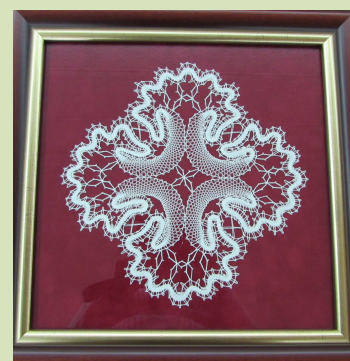
Készítette: Bessenyei Jánosné