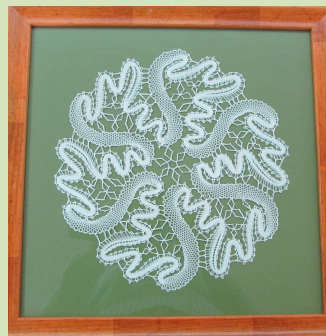
Készítette: Nagy Piroska