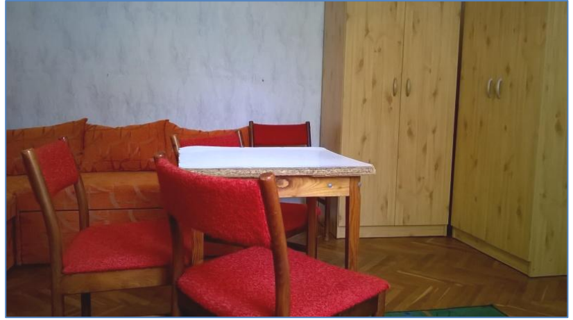
7 szoba (50 fő) férőhely