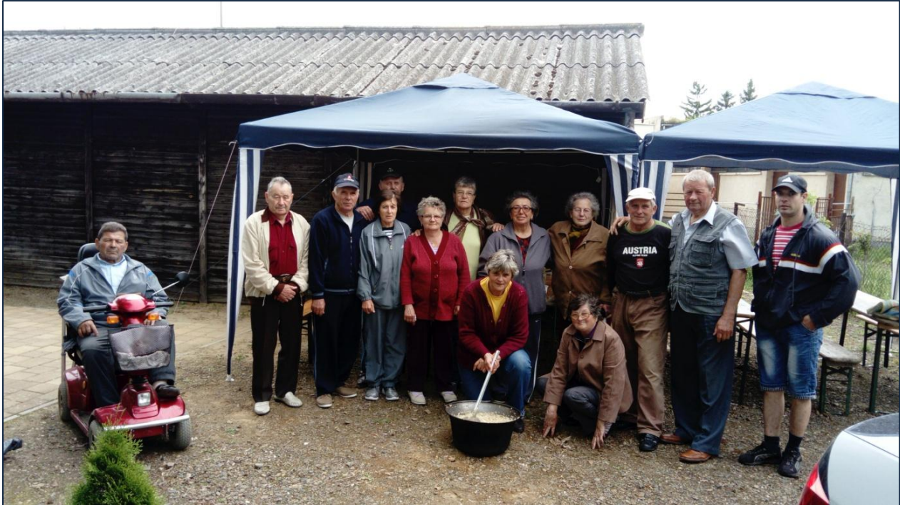
felvétel a 2017. május 5-i rendezvényen

Az Egyeki Hírmondó hasábjain többször értesítettem a kedves lakosságot, hogy elindult egy kezdeményezés. Próbálunk társaságot kereső lakosokat közösségé összekovácsolni, hiszen már Hofi Géza is megmondta: „egyedül nem megy”!