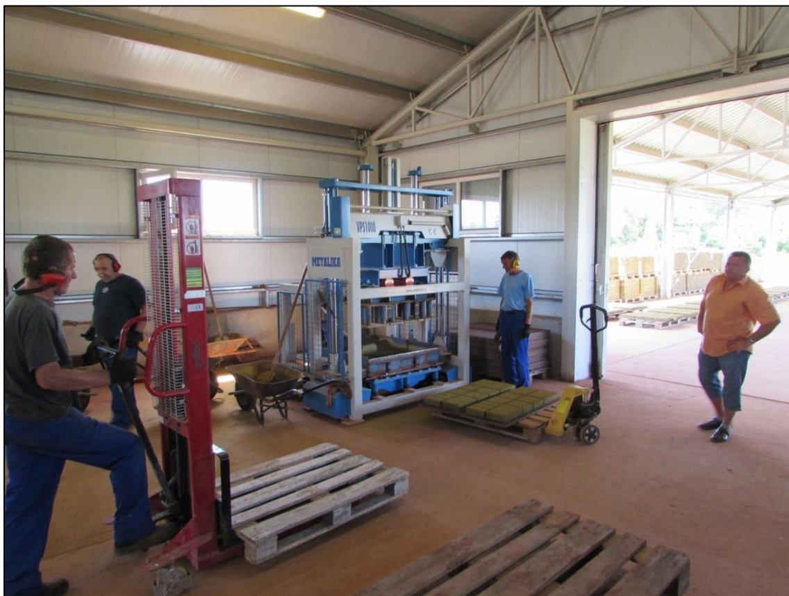
készült, 2017.07.12.

Szintén ebben a ciklusban készült el az Ovifoci pálya , az I.vh.-s emlékmű felújítása, 4 faszobor a Fő téren, 9 utca aszfaltozása , több utca stabilizálása , Fő utcán a vasúti sorompó fele új járda kialakítása, számos bérlakás felújítása, több romos ingatlan eltakarítása és lényeges eredmény még, hogy 2017 tavaszán a betonelemgyártó üzemünkbe új gyártógépet helyeztünk üzembe.