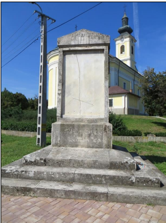
emlékeztetőül: felújítás előtt fordítva