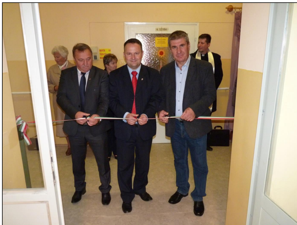
készült az átadási ünnepségen, 2016.10.14.