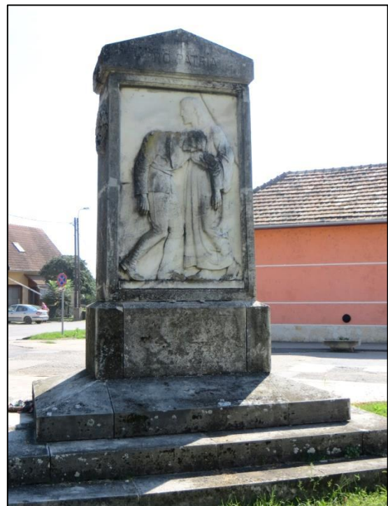
koszosan, repedten, törötten, olvashatatlanul