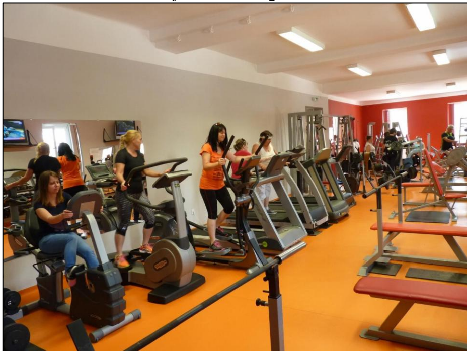
készült a Kihívás napján, 2017.05.01.