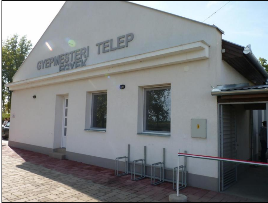
készült az átadási ünnepségen, 2016.10.14.