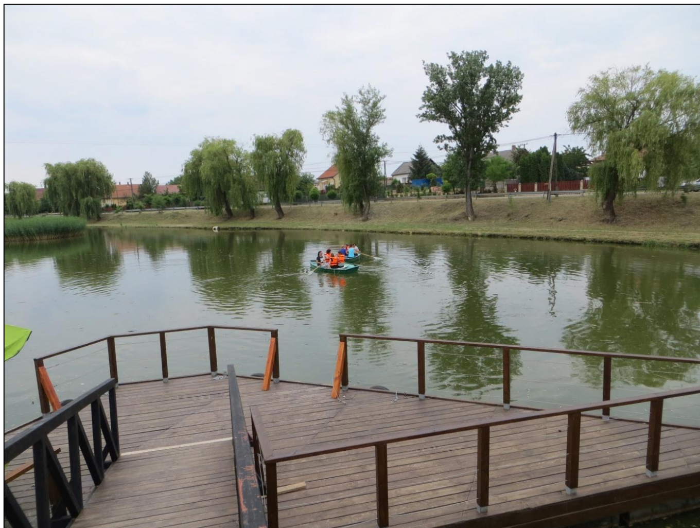
készült a Kihívás napján, 2017.05.01.