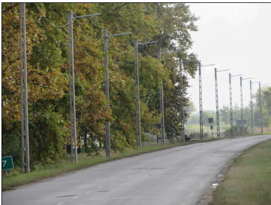
készült az átadási ünnepségen, 2016.10.14.

Szintén ebben a ciklusban készült el az Ovifoci pálya , az I.vh.-s emlékmű felújítása, 4 faszobor a Fő téren, 9 utca aszfaltozása , több utca stabilizálása , Fő utcán a vasúti sorompó fele új járda kialakítása, számos bérlakás felújítása, több romos ingatlan eltakarítása és lényeges eredmény még, hogy 2017 tavaszán a betonelemgyártó üzemünkbe új gyártógépet helyeztünk üzembe.