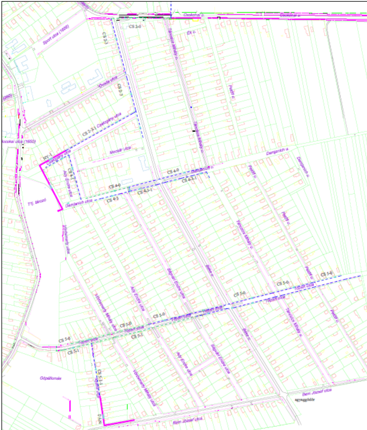
Munkálatokkal érintett utcákat ábrázolja az átnézeti helyszínrajz

A szintszabályozás mellett több utca árkait rendbe tesszük és gondoskodunk arról, hogy azok ne csak szikkasztóként működjenek, hanem vezessék el a vizet a válykos-tónak nevezett záportározóba, onnan, ha szükséges tovább a benzinkút mögötti csatornába. Az itt felgyülemlett víz a Tiszafüredi-főcsatornán keresztül juthat el a Tiszába.