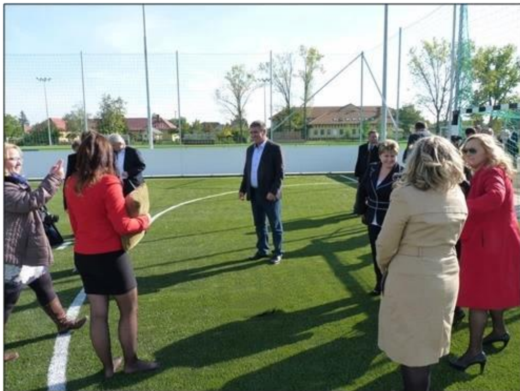
készült az átadási ünnepségen, 2016.10.14.