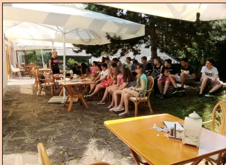
Cikk: 11. oldal