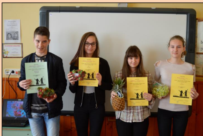
Cikk: 13. oldal